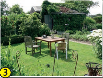
3 Gemüse- und Ziergarten Marita Janssen-Arntz – gegenüber Haus Nr. 7a