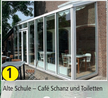
1 Alte Schule – Café Schanz und Toiletten