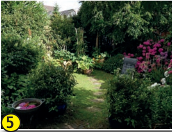
5 Atelier-Garten Claudia Kressin und Urs Hasler – hinter Haus Nr. 9