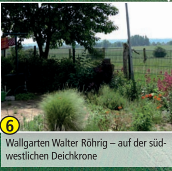
6 Wallgarten Walter Röhrig – auf der süd-westlichen Deichkrone